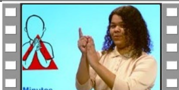
Clase 25 - ¿Qué hora es?