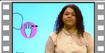
Clase 24 - ¿Quieres comer?