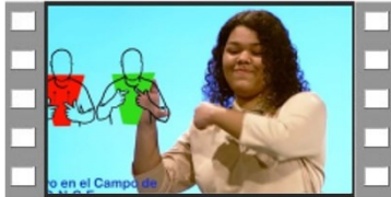
Clase 21 – ¿Dónde vivo?

La Lengua de Señas es un idioma como el Español y el Inglés. La diferencia es que la Lengua de Señas es un idioma no verbal, usamos nuestras manos, la cara y el cuerpo para expresar lo que queremos decir.