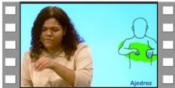
Clase 23 - ¿Quieres jugar?